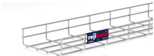
afbeelding 60x60 en 60x200 mm